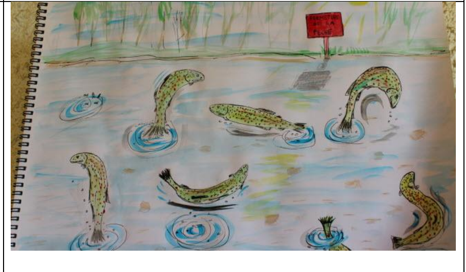
↑ Qui dit pêche arrêtée, dit truites en liesse !!!!

Deux coronavirus participent au méchoui de l'ARSB et lancent : "tousse ensemble tousse ensemble!" (hummm, hummm)