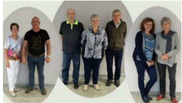
Le nouveau bureau

A l'issue d'un vote les 21 membres du nouveau Conseil d'Administration ont été élus. Le CA a ensuite procédé à l'élection du nouveau bureau.